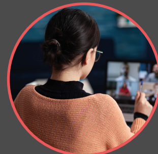
Visios entre psychomotricien·nes (P.12)