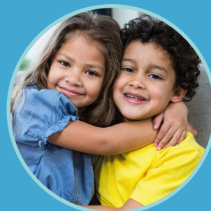
Rencontres entre fratries (P.12)