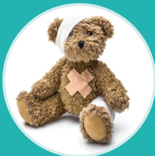
Gestion de la douleur chez la personne avec TSA (P.7)