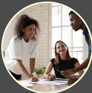
Rencontres entre professionnel·les du secteur social (P.12)