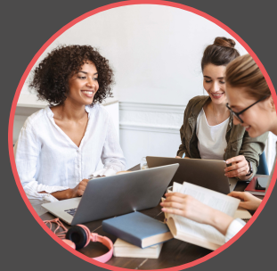
Rencontres entre orthophonistes (P.11)