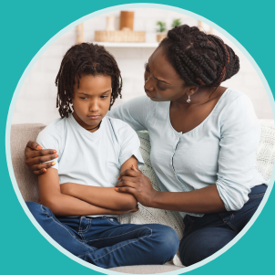
Gestion des comportements-défis (P.5)