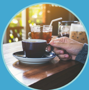
Rencontres Aspi' (P.10)