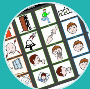
Outils de CAA et modélisation (P.8)