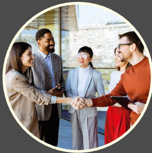
Rencontres entre psychologues (P.10)