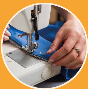
Fabrication d'objets lestés (P.10)