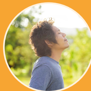
Bien-être et relaxation (P.12)