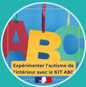
Découverte du kit ABC (P.4)