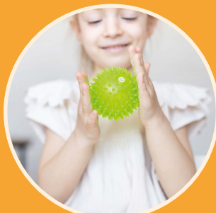
Découverte de matériel sensoriel (P.11)