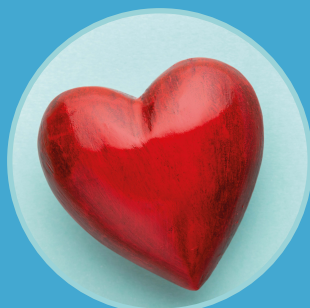
Échanges autour de la VRAS (P.11)